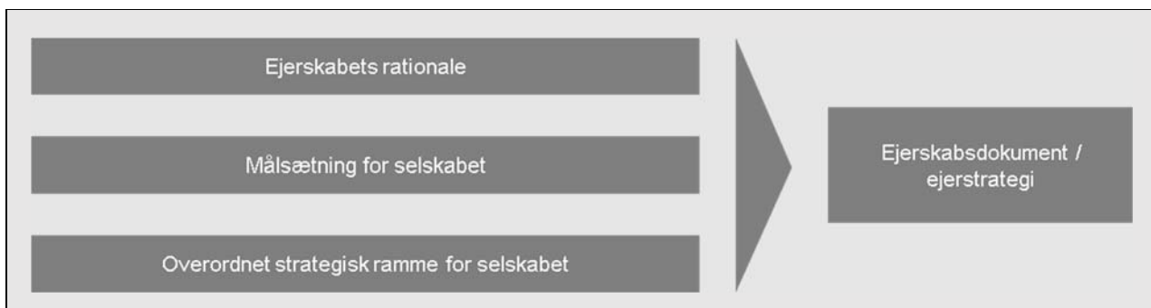
Figur 1: Styringshierarki for ejerskabsudøvelse

I det følgende behandles de enkelte punkter i styringshierarkiet mere detaljeret.