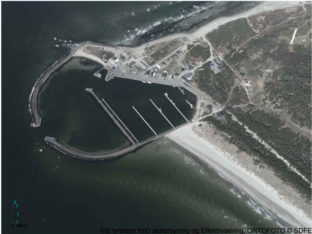
Området set fra syd