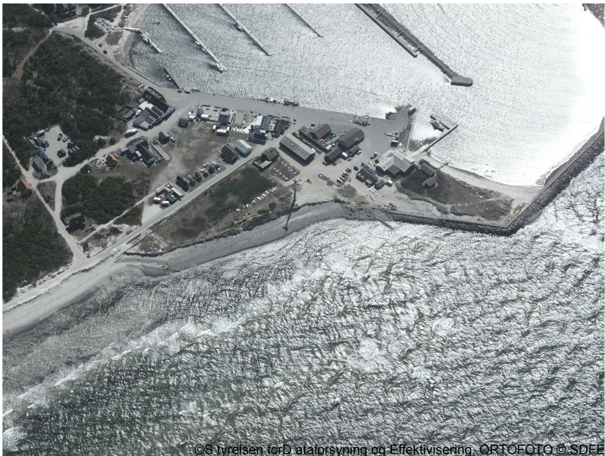
Området set fra nord